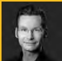
Roman Starke Fotograf, Mediengestalter