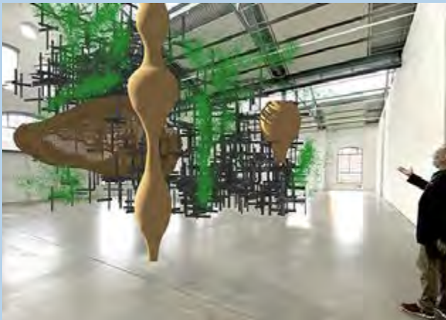
Christian Odzuck, Casa senza noma, 2023 - Konzeptskizze

Für die Kunsthalle Lingen entsteht eine raumgreifende Installation, die formal und inhaltlich von dem Mythos um die „Hängenden Gärten von Babylon“ inspiriert wurde.